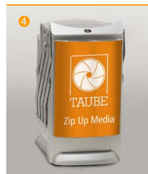
Cover für A4 Einlegeblatt