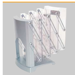
Alle beweglichen Teile sind verschraubt