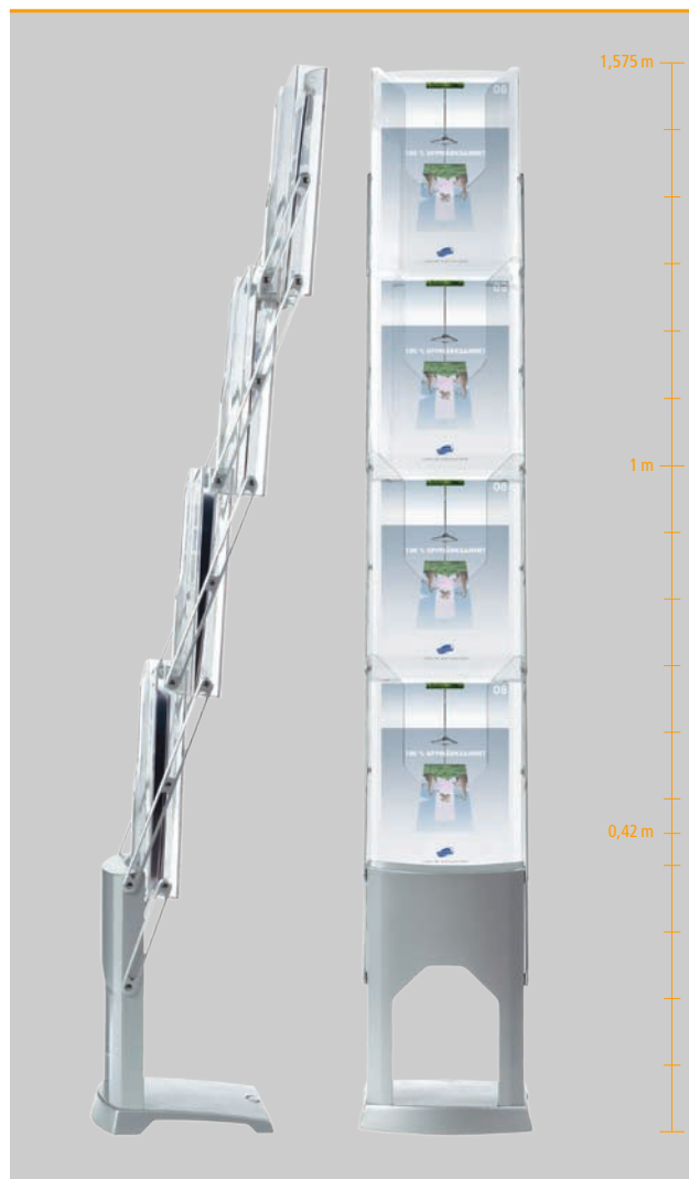
Bequeme Entnahme der Werbeunterlagen