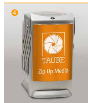
Cover für A4 Einlegeblatt