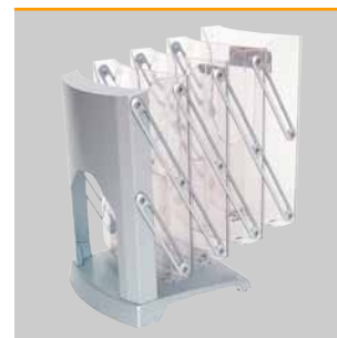
Alle beweglichen Teile sind verschraubt