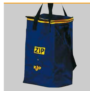
Optimaler Schutz mit der Transporttasche