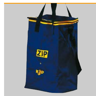
Optimaler Schutz mit der Transporttasche